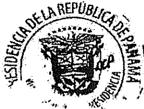
JUAN CARLOS VARELA RODRÍGUEZ Presidente de la República

Dado en la ciudad de Panamá, a los 27 días del mes de Noviembre de dos mil quince (2015).